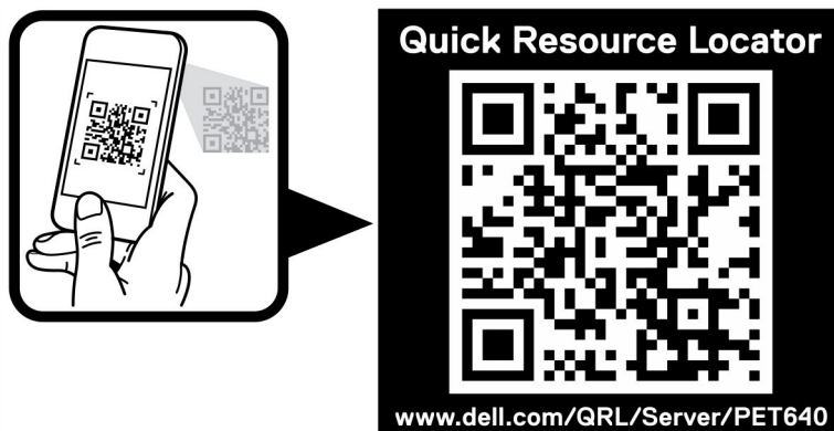
Ilustración 2. Quick Resource Locator [Localizador de recursos rápido] para PowerEdge T640